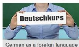
German as a foreign language