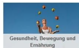
Gesundheit, Bewegung und Ernährung