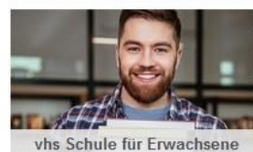
vhs Schule für Erwachsene