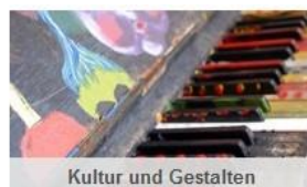
Kultur und Gestalten