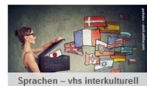
Sprachen – vhs interkulturell