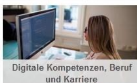
Digitale Kompetenzen, Beruf und Karriere