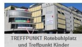
TREFFPUNKT Rotebühnplatz und Treffpunkt Kinder