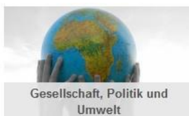
Gesellschaft, Politik und Umwelt