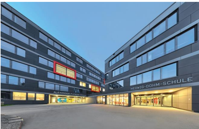
Das moderne Unterrichtsgebäude der Hedwig-Dohm-Schule

Auf die verschiedenen bundesweiten XB-Prüfungen bereiten Sie fachlich ausgewiesene und erfahrene Dozent/innen effektiv vor. Ziel ist die Vermittlung von aktuellen, fundierten und praxisnahen beruflichen Kenntnissen in vielen kaufmännischen Themenbereichen. Unser Ziel ist die Vermittlung von Fachwissen in kurzer Zeit.